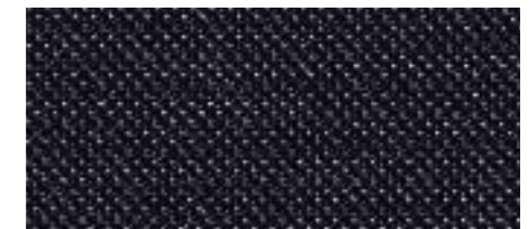
Assise : Tissu Airfield Ebène Renforts latéraux : Cuir** Napoli Ebène