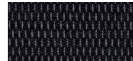
Assise : Tissu Rack Anthracite Renforts latéraux : Tissu Gecko Anthracite

**Seuls les revêtements de l'assise, du dossier et des renforts latéraux des sièges sont revêtus des garnissages mentionnés.